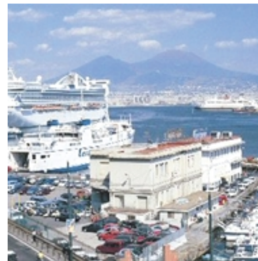
Il porto di Napoli; a lato e sotto due navi Grimaldi